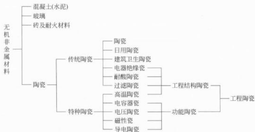
图1-2 无机非金属材料的分类