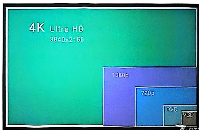
图 3-39 视频尺寸对比图