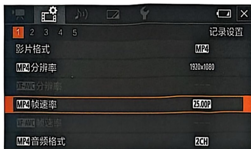
图 3-37 帧速率参数图

又称解析度、解像度，可以从显示分辨率与图像分辨率两个方面来分类。显示分辨率（屏幕分辨率）是屏幕图像的精密度，是指显示器所能显示的像素有多少。分辨率 160 \times 128 的意思是水平方向含有像素数为 160 个，垂直方向像素数 128 个。屏幕尺寸一样的情况下，分辨率越高，显示效果就越精细。如图 3-38 所示。